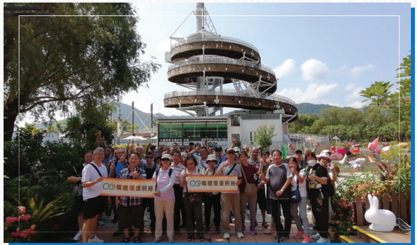
職聽會友及其照顧者暢遊大埔海濱公園時開心合照！