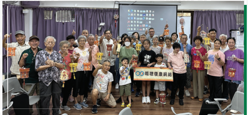
職聰義工與單親家庭成員一起製作環保燈籠，歡度中秋佳節。