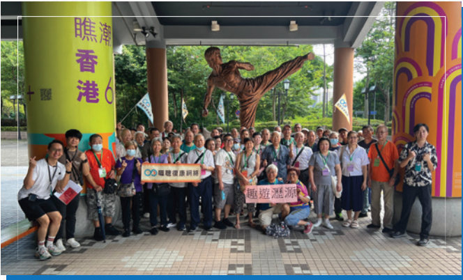
職聽會友在「趣遊瀝源」活動中合照。