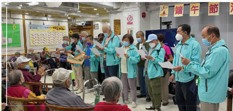
職聰義工在端午節探訪長者中心時獻唱。