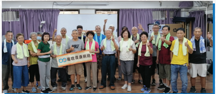
職聽會友大讚「排毒毛巾操」功效好！