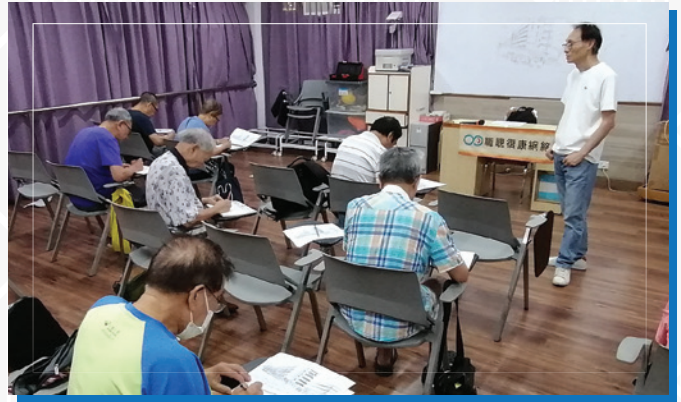
職聽會友在「鉛筆風景畫入門」班課堂中聚精會神地繪畫不同景致的風景畫。