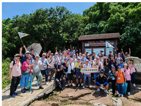
職聰會友及照顧者於東平洲地質公園留下倩影。