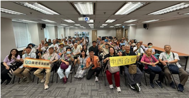
職總會友在「安全社區體驗館」拍攝團體大合照。

隨後，帶領職總會友參觀了中環街市，這個擁有悠久歷史的街市經過活化再生，成功保留了原有的建築風貌，並融入現代設計元素。透過導賞員的講解，職總會友充分了解到中環街市的過去與變遷，見證了香港如何在保育與創新之間取得平衡，讓傳統建築得以重獲新生。這次的參觀活動內容豐富，不僅提升了職總會友的安全意識，還讓他們感受到歷史文化的魅力。這真是一次寓教於樂、收穫滿滿的學習之旅。