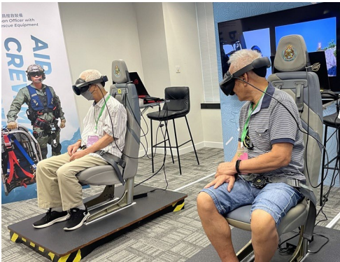
職總會友在「安全社區體驗館」中體驗了飛行服務隊在進行飛行拯救工作的虛擬實境，增進了對社區安全的。