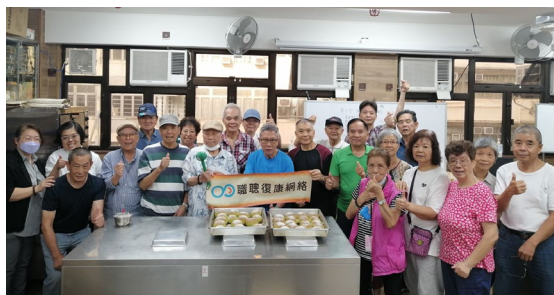
職聰會友非常滿意親自製作的麵包！