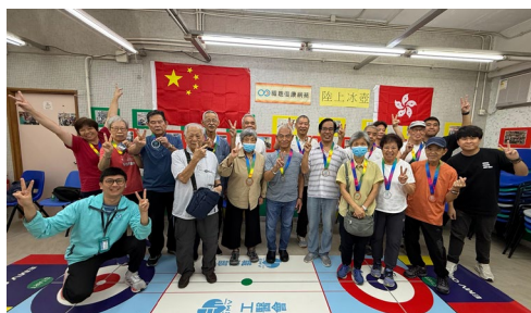
職聰會友在「陸上冰壺」競技中獲得殊榮。