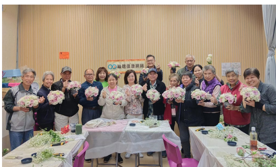
一眾職聰會友在「以『物』傳情」活動中親手製作精美花束，送給至愛。