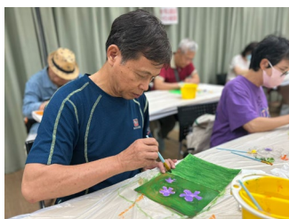
職總會友很專心地利用 塑膠彩創作及繪畫

在 7-9 月份季度中， 四方會 將繼續舉辦「塑膠彩畫班」，如職總會友有興趣體驗這個發揮創意及舒展身心的班組，可於活動報名期間致電或 WhatsApp 向 四方會 報名。