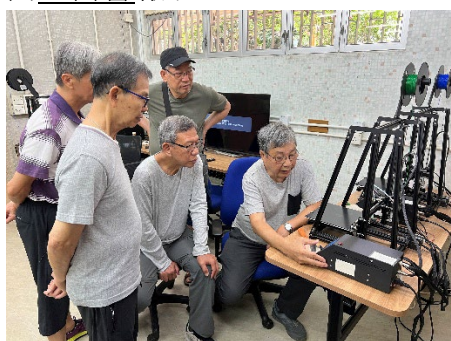
職總會友在三維打印技術體驗班中學習操作打印機。

如職總會友有興趣參加「三維打印技術體驗」工作坊，可於活動報名期間致電或 WhatsApp 向 工醫會 報名。