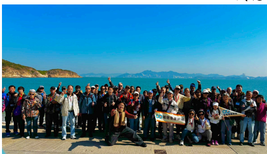
職聰會友參加了一個藍天白雲的長洲之旅