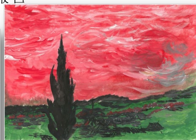
職總會友的畫作真具創意，配色新穎奪目！