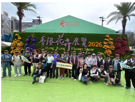
職聰義工在「香港花展職聰環保大使 2026」活動中合照