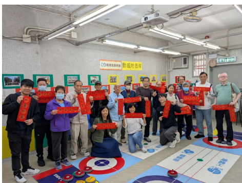
職聰會友在「動感地壺球」活動中互相贈送揮春，互相祝賀。