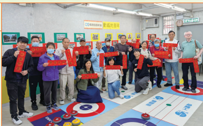
職聰會友在「動感地壺球」活動中互相贈送揮春，互相祝賀。