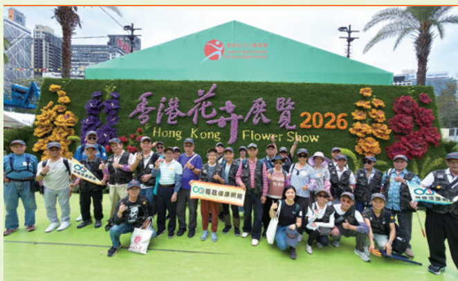
職聰義工在「香港花展職聰環保大使2026」活動中合照