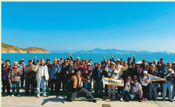
職聰會友參加了一個藍天白雲的長洲之旅