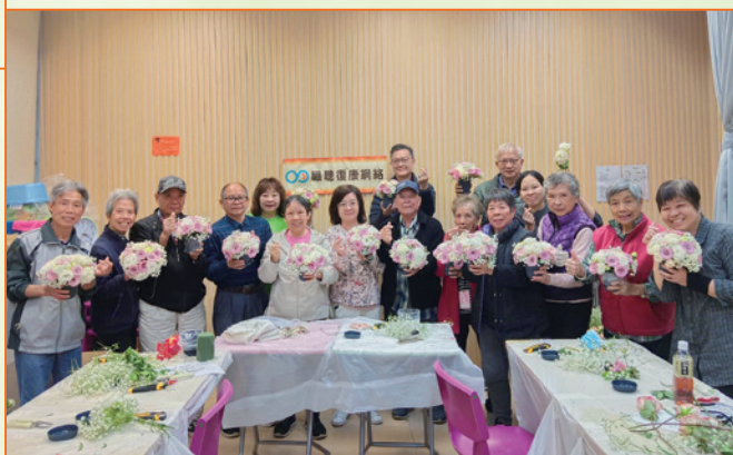
一眾職聰會友在「以『物』傳情」活動中親手製作精美花束，送給至愛。

假如職聰會友需要更新您的通訊電話、地址或其他個人資料，請致電 2723 1288 或電郵至 contact@odcb.org.hk 通知管理局職員。若閣下不欲接收此「職聰之聲」季刊，亦請致電通知管理局，日後您將不會收到「職聰復康網絡」所提供的活動及服務的資訊，但這不會影響您有關申請聽力輔助器具資助計劃和參加復康服務及活動的權利。